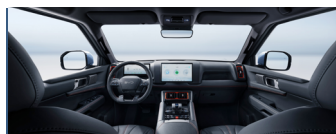
Black Interior with Orange Stitching + Black Ceiling