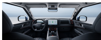
Black Interior with Orange Stitching + Gray Ceiling